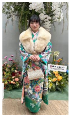
← → 二十歳のつどいに 卓球を楽しむMさん

先日、娘が鳥取から戻ってきて二十歳のつどいに参加しました。着物は着物好きの祖母が私の為に買ってくれたものを着用したのですが、私よりも数倍も似合っており、まるで娘の為に挑めたように綺麗でした。娘の生まれる3週間前に亡くなった祖母が天国で喜んでいることと思います。娘が5年生の時に店を始めたので、その頃から娘を知っているお客様方もまるで自分の孫や子供のように喜んでくれて、娘も家族が沢山いるようだ感激していました。本当にありがたいことです。私も子育てが一区切りしたと少しほっとしているところです。